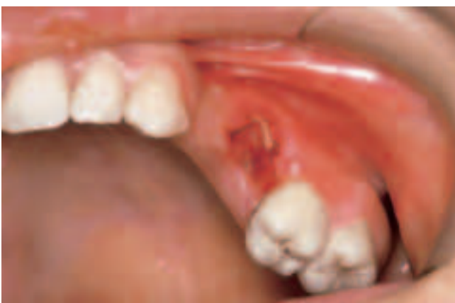
Abb. 5 Knochensequester etwa zwei Wochen nach Entfernung des Zahnes 26

Fig. 4 Photo classique d'une infection région 48, quatre semaines après ostéotomie