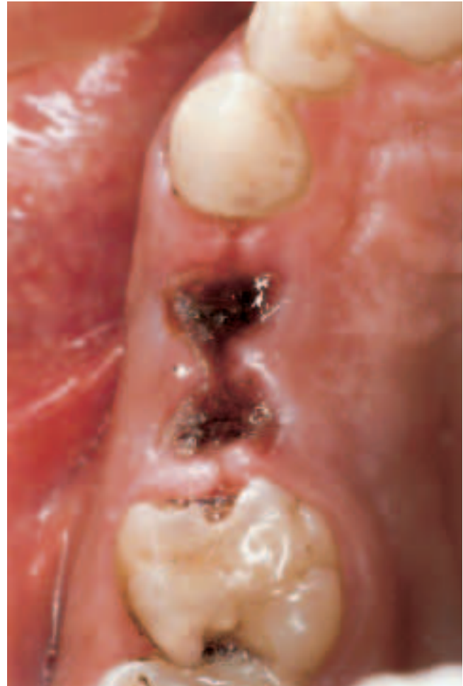
Abb. 2 Eher graue Farbe des Koagulums 48 Stunden nach Zahntfernung durch Leukozytenwall

Fig. 1 Couleur rouge classique du coagulum quelques minutes après extraction de la dent