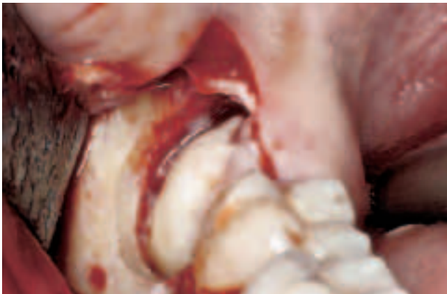
Abb. 11 Situation nach Osteotomie: Darstellung der grössten Zirkumferenz der Krone 48 Fig. 11 Situation après ostéotomie: représentation de la plus grande circonférence de la couronne 48