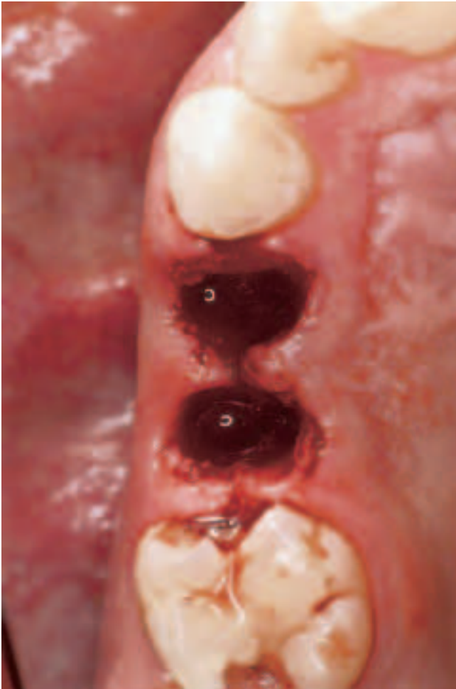
Abb. 1 Typische rote Farbe des Koagulums wenige Minuten nach Zahntfernung

Die Epithelisierung der Alveole bzw. Osteotomiehöhle erfolgt von der begrenzenden Gingiva her und ist nach etwa sieben bis zehn Tagen beendet (MEYER 1956, KRÜGER 1989). Sie basiert auf einer Kombination aus Migration, Zellteilung und Zelldifferenzierung (ANDERSEN 1978). 12–24 Stunden nach Wundsetzung beginnt die Zellmigration (KÜHNAU 1962, ORDMAN & GILLMAN 1966, MCMINN 1969, KRAWCZYK 1971, MARTINEZ 1972, WINTER 1972, GOTEINER et al. 1977, PANG et al. 1978, STENN & DEPALMA 1988, CLARK 1990, STENN & MALHOTRA 1992). Zellen des Stratum basale im Bereich des Wundrandes verlieren ihre feste Anheftung, befreien sich und beginnen mit Migration über die Oberfläche der vorläufigen Matrixfüllung der Alveole. Verflüssigtes Fibrin bildet eine Art «Gleitbahn». Vom Stratum basale