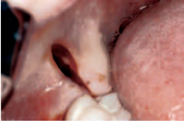
Abb. 9 Schnittführung Fig. 9 Incision