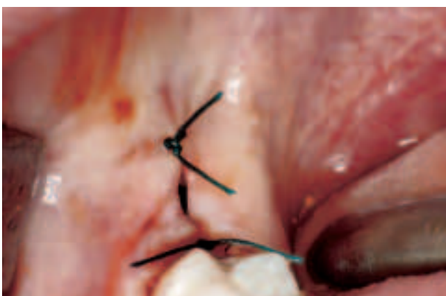
Abb. 13 Lappenreposition und Nahtversorgung Fig. 13 Repositonnement des lambeaux et suture