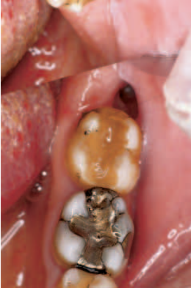
Abb. 4 Typisches Bild einer Wundinfektion regio 48 vier Wochen nach Osteotomie

Fig. 4 Photo classique d'une infection région 48, quatre semaines après ostéotomie