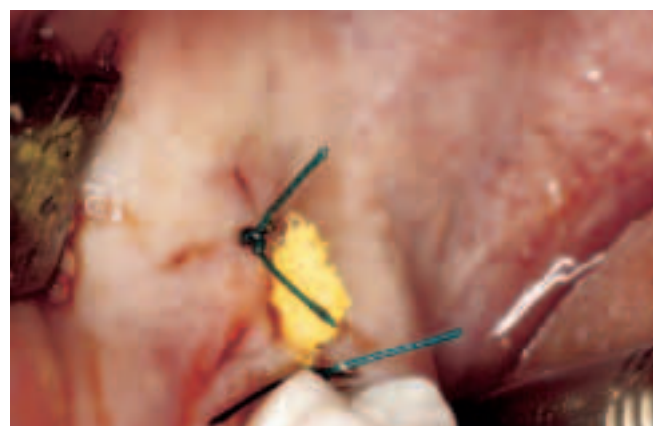
Abb. 14 Applikation der Drainage dorsal der ersten Naht distal des Zahnes 47 Fig. 14 Application du drainage dorsal de la première suture distale de la dent 47

offenen Wundbehandlung (Abb. 8–14). Es werden derzeit Baumwollstreifen mit Jodoform-Paste (30%) appliziert. Die Drainage wird in der Regel am zweiten, die Naht am siebten postoperativen Tag entfernt. Als Medikation nach dem Eingriff