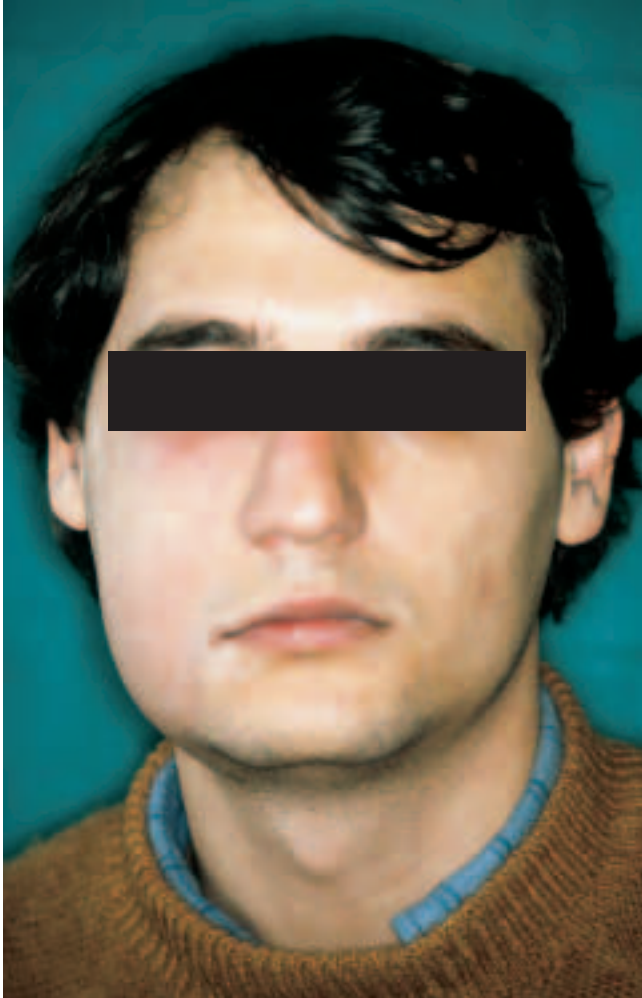
Abb. 6 Spätabszess vier Wochen nach Entfernung des Zahnes 18 Fig. 6 Abscès tardif, quatre semaines après extraction de la dent 18