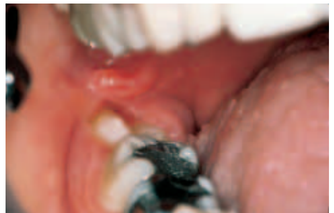
Abb. 7 Typisches Bild einer Pericoronitis regio 48 Fig. 7 Photo classique d'une péricoronite, région 48