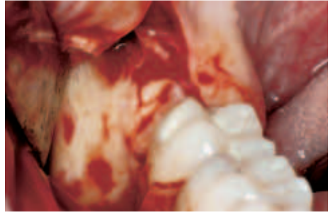
Abb. 10 Situation nach Präparation des Mukoperiost-Lappens Fig. 10 Situation après la préparation des lambeaux mucopériostaux