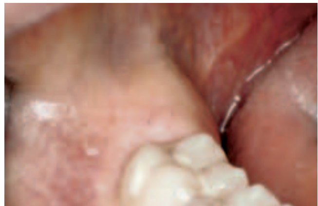
Abb. 8 Klinische Situation vor Osteotomie Zahn 48

In der Klinik für zahnärztliche Chirurgie, -Radiologie, Mund- und Kieferheilkunde der Universität Basel werden operative Entfernungen dritter Molaren nach präoperativer Keimreduktion in der Mundhöhle durch eine antimikrobiell wirkende Spüllösung (PVP-Jodlösung oder Chlorhexidinguconat) und perioraler Desinfektion der Lippen und der Gesichtshaut durchgeführt. Die Wundversorgung erfolgt im Sinne einer halb-