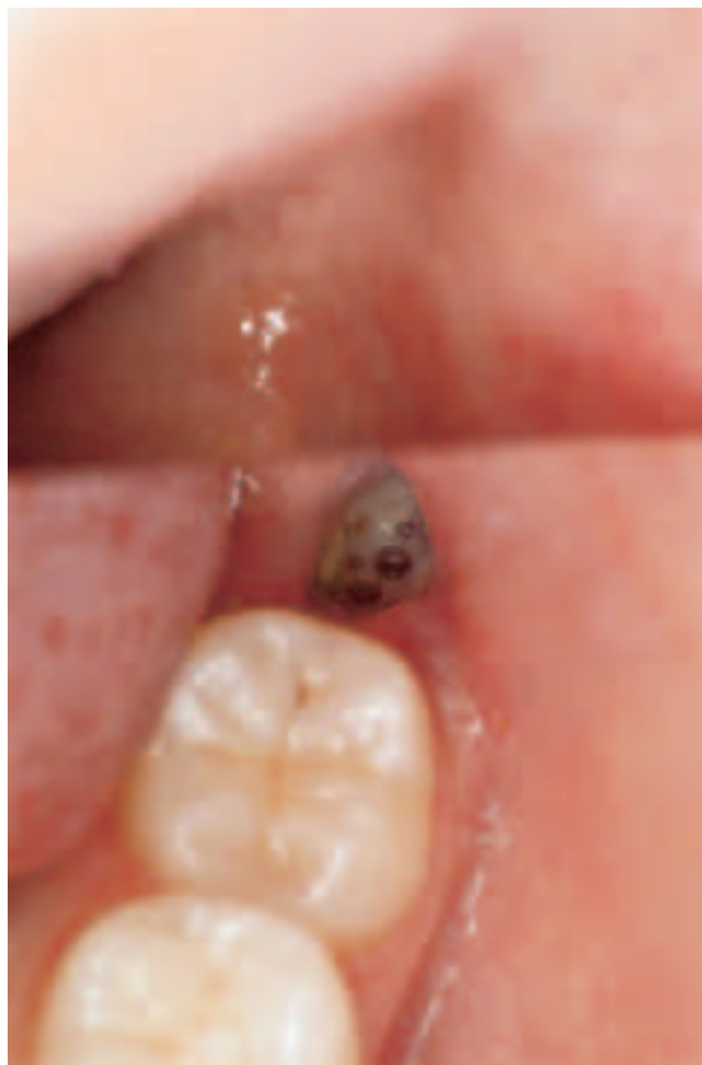
Abb. 3 Typisches Bild einer Wundinfektion regio 38 eine Woche nach Zahnentfernung

Die Wundheilungsstörung nach operativer Zahnentfernung zeigt ein in Abhängigkeit vom Ausbreitungsgrad der Infektion abgestuftes klinisches Bild. Zwei bis vier Tage post operationem kommt es in typischer Weise zu progredienter Schmerzsymptomatik (MÜLLER 1990, REICHART 1995). Die zunächst noch lokalisierbaren bohrenden, klopfenden Beschwerden strahlen im fortgeschrittenen Stadium über die gesamte Kieferhälfte bis hin zum Ohr und in die Temporalisregion aus und gehen in einen ziehenden Schmerz über. Die Inspektion der Wunde zeigt häufig ein putride zerfallenes Koagulum (Abb. 3 und 4). Die Wundränder sind ödematös verändert und sehr palpationsempfindlich. Begleitend wird Foetor ex ore beobachtet (REICHART 1995). Knöchernen Strukturen liegen frei oder sind von graugrünlichem Detritus belegt. Die regionalen Lymphknoten sind häufig beteiligt. In Abhängigkeit vom Grad des Entzündungsgeschehens